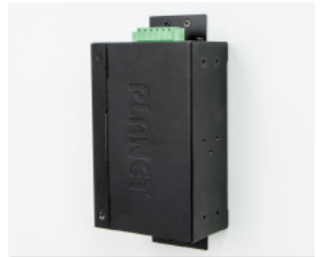
Side Wall Mounting (Space saving)