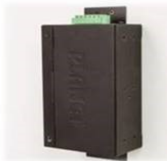
Wall mounting (Space saving)