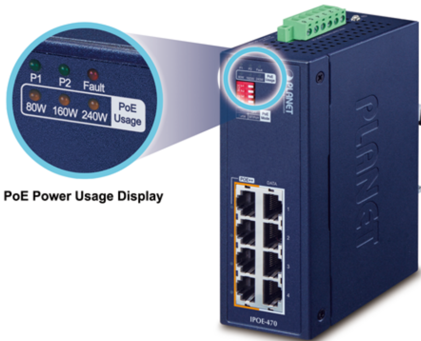
PoE Power Usage Display