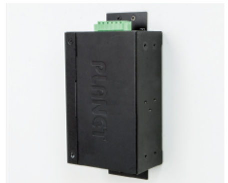
Side Wall Mounting (Space saving)