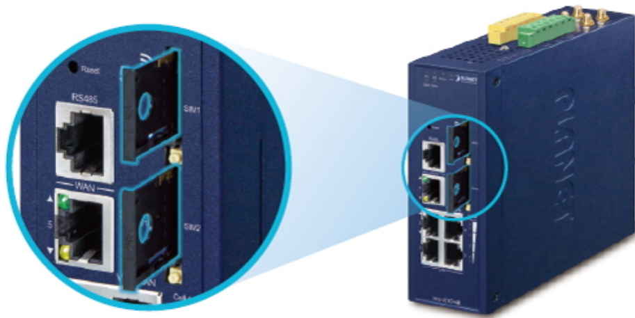
Dual 5G NR