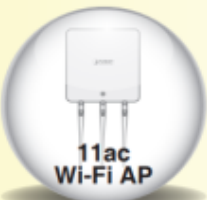
11ac Wi-Fi AP