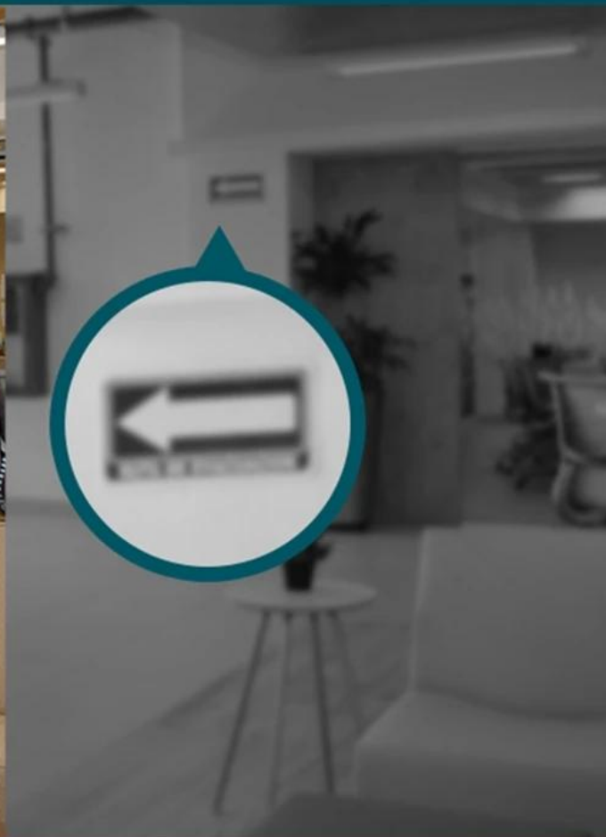
3MP IR Camera