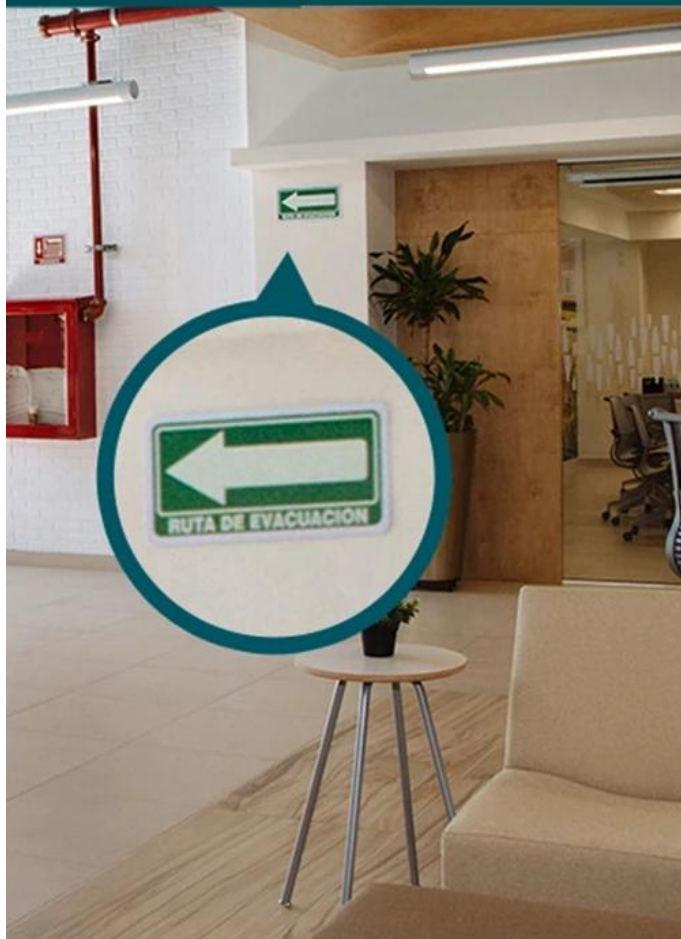
VIGI 5MP Full-Color Camera